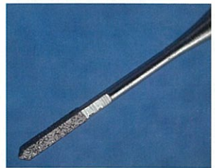
ダイヤモンド電着加工品