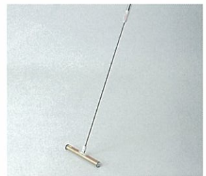
ニードル・ハンター