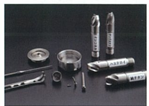
微細・高精度複合加工品